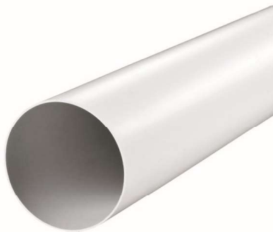
Rys. 3. Kanał PCV okrągły