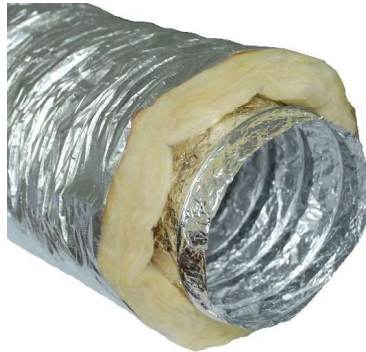
Rys. 2. Przewód elastyczny izolowany nieperforowany