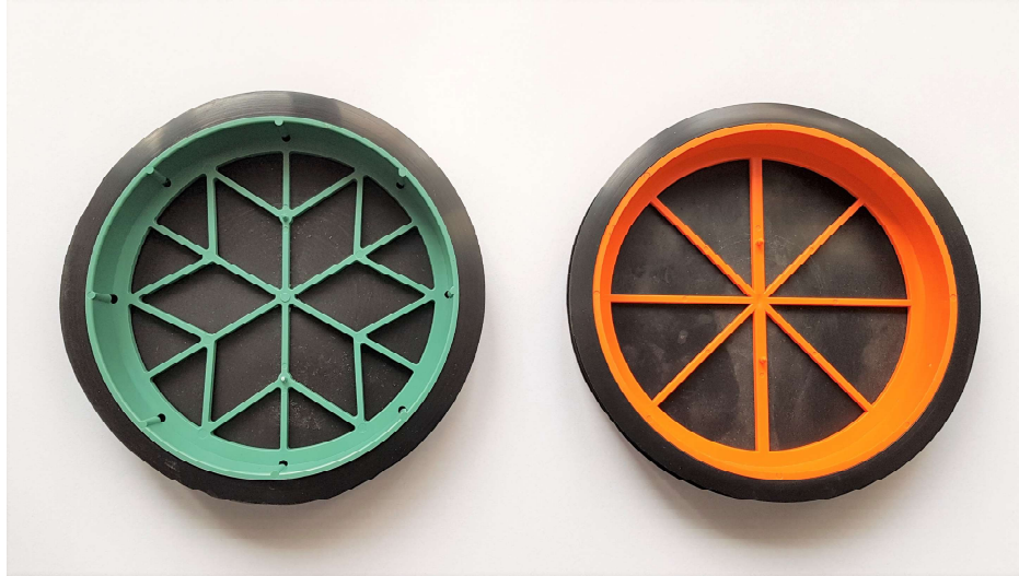
Rys. 1. Klapa zwrotna

Zaleca się zastosowanie okapu, który funkcjonuje jako pochłaniacz w obiegu zamkniętym. Przy prawidłowym działaniu wentylacji pochłaniacz ma za zadanie jedynie zatrzymać tłuszcze i inne ciężkie zanieczyszczenia powstające w czasie gotowania a zapachy i przefiltrowane z tłuszczy brudne powietrze zostaną usunięte przez system wentylacji mechanicznej niskociśnieniowej. W przypadku zastosowania okapu kuchennego jako pochłaniacza - wejście do kanału przeznaczonego do podłączenia okapów należy szczelnie zaślepić.