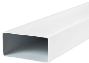
Rys. 5. Kanał prostokątny plastikowy

Nie należy stosować niżej wymienionej kształtki: