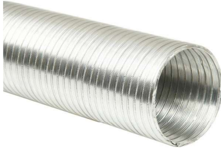
Rys. 7. Przewód sztywny aluminiowy

Serwis oraz prace naprawcze wentylatorów prod. Hybryd16— tylko wykwalifikowany serwis firmy HYBRYD16 .