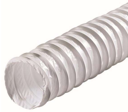
Rys. 4. Przewód rozciągliwy