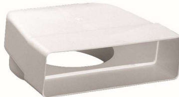
Rys. 6. Kształtka stosowana przy kanale prostokątnym

Nie należy stosować niżej wymienionej kształtki: